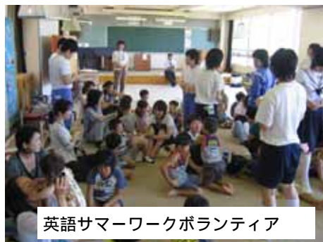
英語サマワークボランティア

9月は、前期の終わりです。と同時に、役割活動の締めくくりの時期です。役割を選び取ったはじめの気持ちをもう一度思い出し、最後のやりきりを行きましょう。