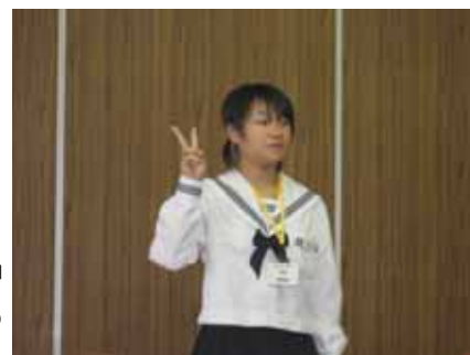
英語スピーチコンテスト

42日間の夏休みが本当にあっという間に終わりました。その間に、部活動の練習や試合・コンクール、ボランティア活動、町や学校で行われた学習会、地域などの行事などがありました。大きな成果を残せた人も、残念ながら思ったような結果に結びつかなかった人もいます。しかし結果はどうかあれ「精一杯がんばれた」という思いが、私は大切だと思います。始業式には、校長先生や生徒代表の話の中で、「精一杯がんばった事実」はたくさん紹介されましたが、みなさんの一人一人の中にもきっとあることと思います。そういう事実を励みにして、2学期はじめのスタートを気持ちよく切れるようにしていきましょう。